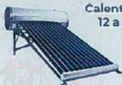
Calentador Solar 12 a 24 tubos