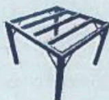
Base para tinacos